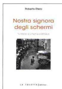
Roberto Ellero, La Toletta, Pagg. 176, € 16,00

■ Immortalata da migliaia di film, spot, documentari, video e cinegiornali, la città di Venezia può davvero essere considerata «Nostra Signora degli schermi». Sulla grandezza del suo mito cinematografico (nonché sulle numerose personalità, italiane e straniere, che l'hanno plasmato) e sulla sua eredità culturale a rischio (specie a causa della strumentalizzazione urbana a scopi turistici) riflette il critico Roberto Ellero, raccogliendo una serie di scritti a tema pubblicati nel corso degli anni e rielaborandoli tramite un punto di vista attuale.