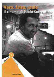
Augusto Sainati (a cura di), ETS, Pagg. 126, € 14,00

LA MUSICA SECONDO KUBRICK Sergio Bassetti, Lindau, Pagg. 192, € 19,00